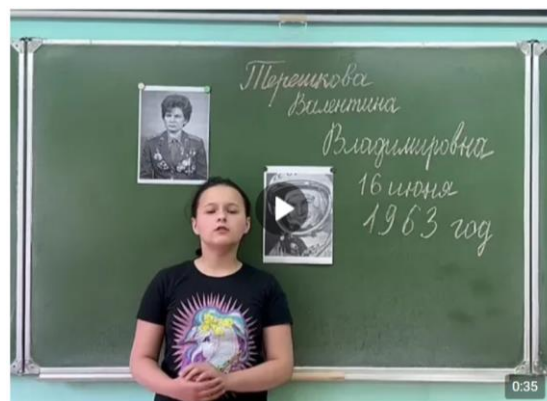
Видео от Школа №5. Кольчугино. 2726 просмотров

Участники акции «Я - Чайка! Чувствую себя отлично!» написали стихи о первой женщине-космонавте Валентине Владимировне Терешковой.