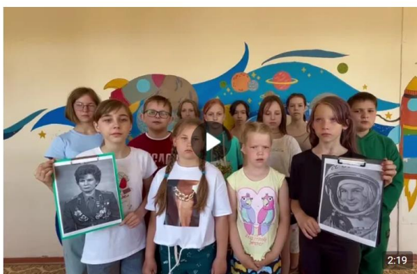
Видео от Школа №5. Кольчугино. 1 655 просмотров

Когда ракета готовится к взлету, звучит обратный отсчёт: 10...9...8...7... Так же было и 60 лет назад. Увидев красоту нашей планеты из космоса, Валентина Владимировна Терешкова произнесла: «Эй! Небо, сними шляпу».